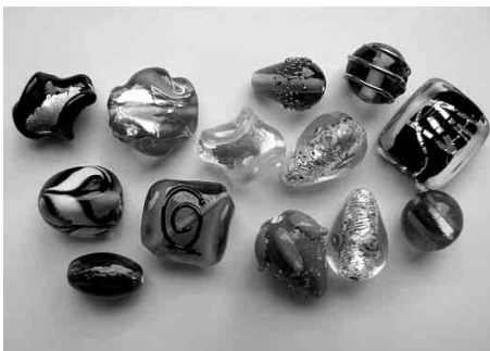
Skleněné perle od firmy Kortan-sklo bižuterie