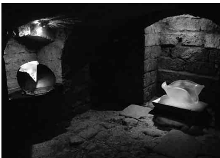
Galerie na Rynku