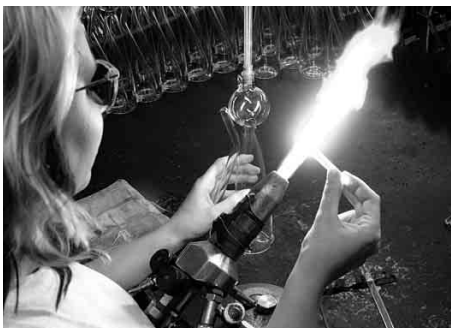
Detesk s. r. o., foukání technického skla